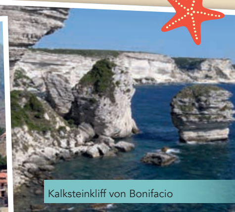
Kalksteinkliff von Bonifacio