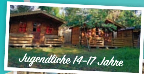
Jugendliche 14-17 Jahre